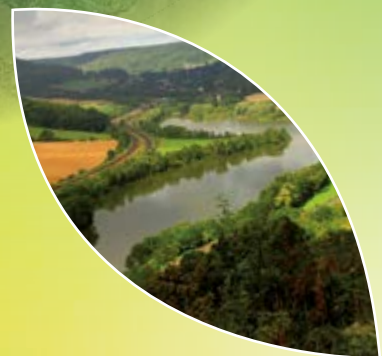
Mémorial américain de la Butte de Montsec et lac de Madine