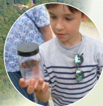
Lac d'Orient (2300 ha)