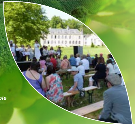
Hautvillers et son vignoble