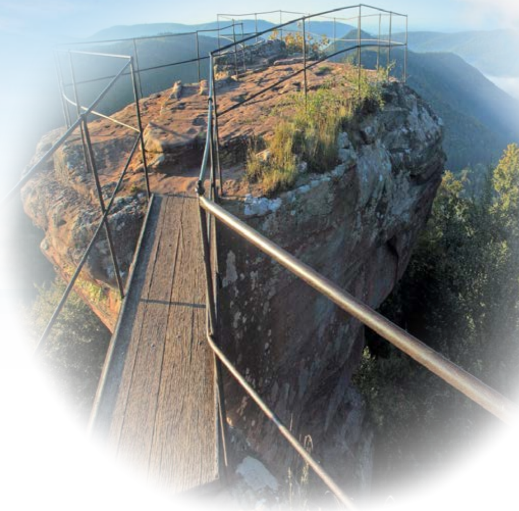
Château du Loewenstein (Wingen - Parc Naturel Régional Vosges du Nord). Probablement construit au XIII e siècle.

Les Parcs naturels régionaux ont été créés pour protéger et valoriser des espaces ruraux habités, exceptionnels par leurs paysages, leurs patrimoines naturels, bâtis et culturels considérés à la fois comme riches et fragiles. Ils cherchent à développer ces territoires tout en protégeant et en mettant en valeur les patrimoines.