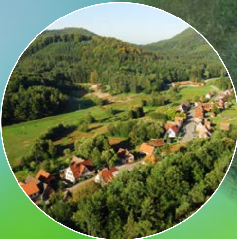
Paysage forestier Château du Windstein (67)