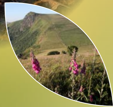
Grand Ballon (1424m) au sud de la fameuse route des crêtes