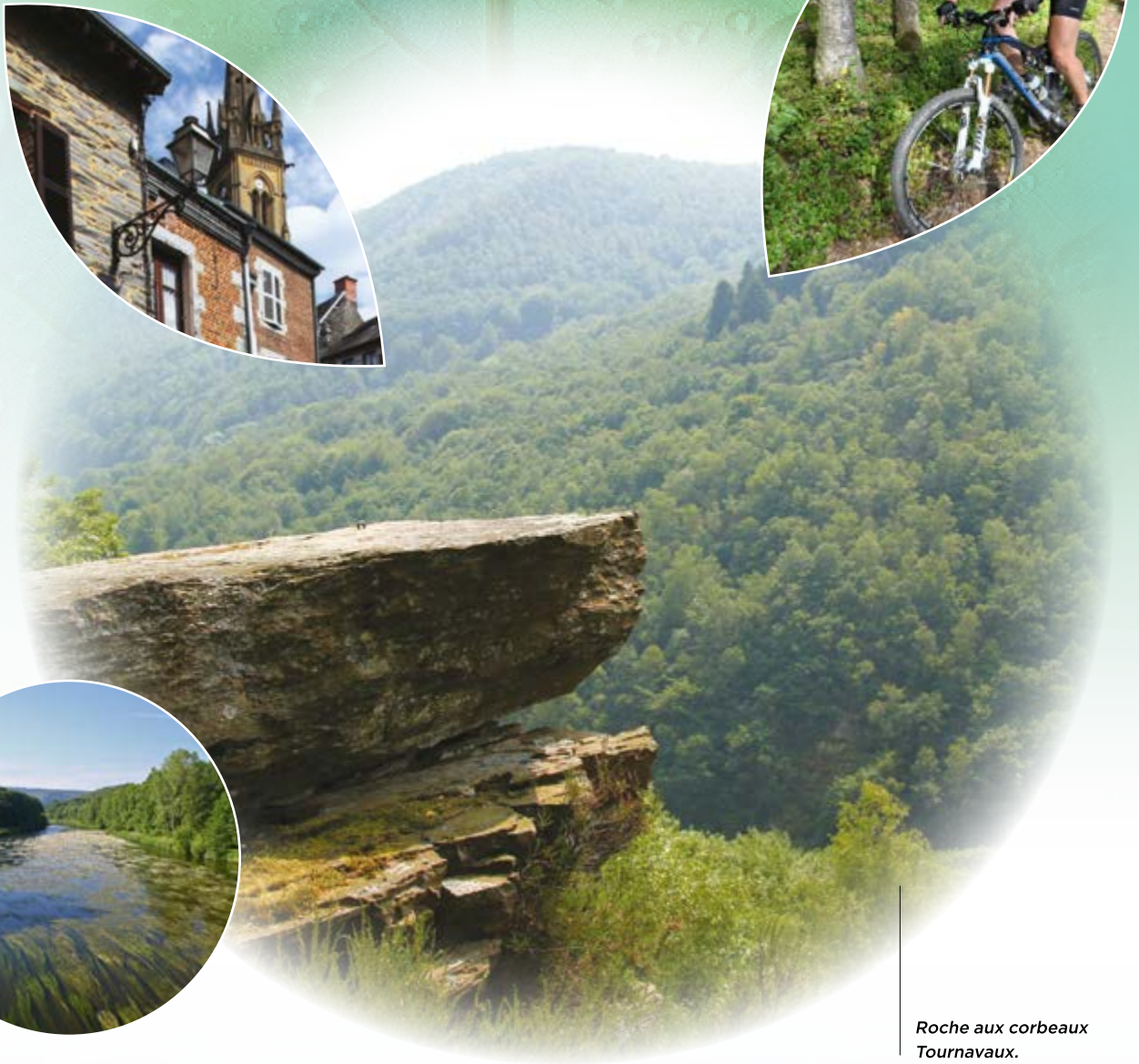
Roche aux corbeaux Tournavaux.